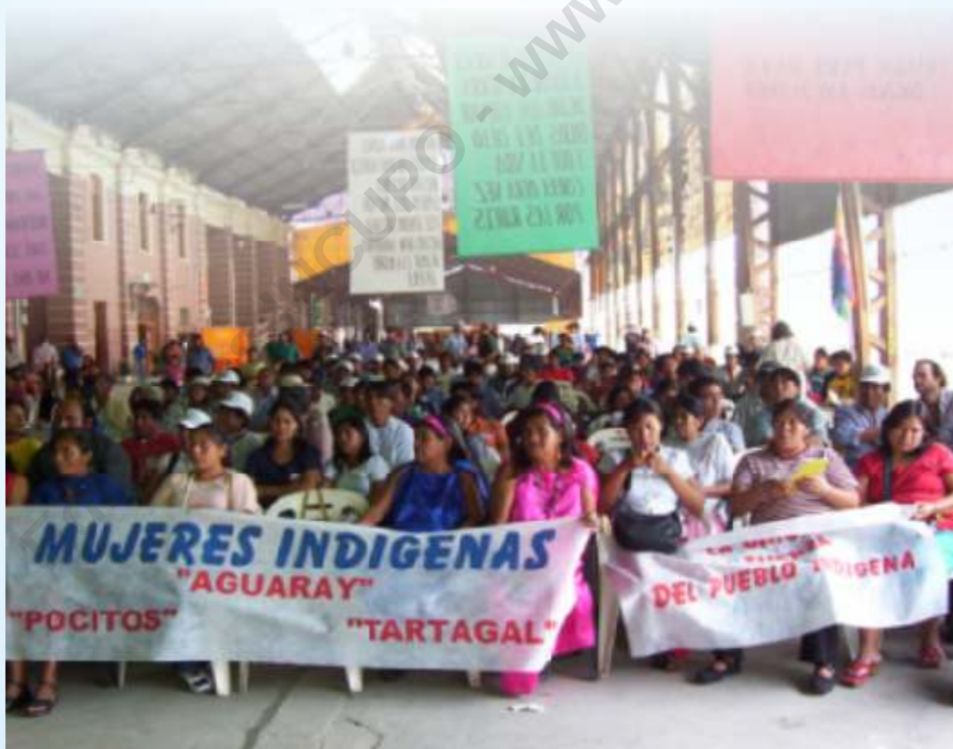
Encuentro aborigen, PSA, año 2003.

Desde mediados de los '90 hubo aceleración del proceso de CONCENTRACIÓN AGRARIA.