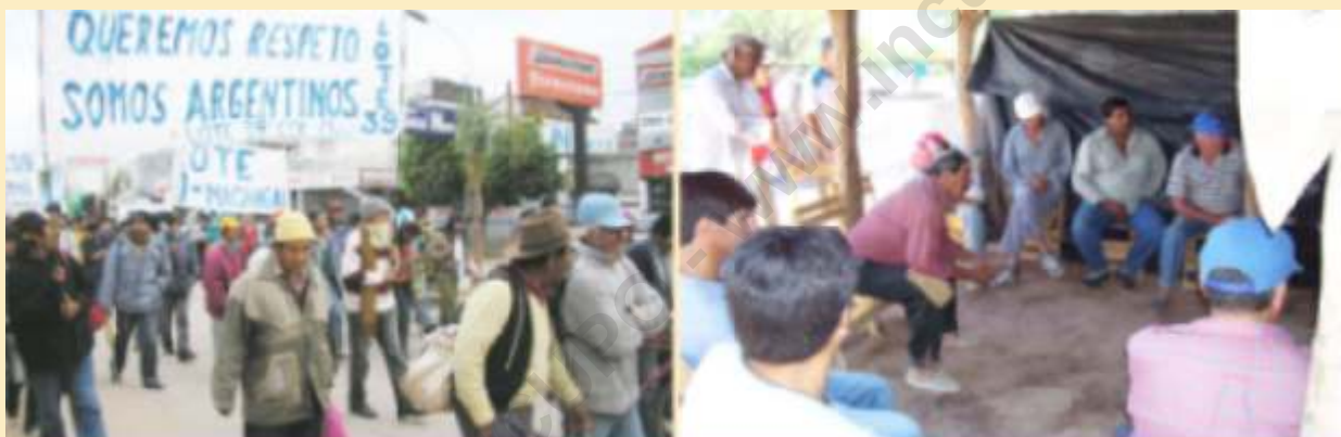
Movilización aborígen en Chaco, junio de 2006.

Este campo tiene sus propios protagonistas. Las comunidades aborígenes, los pequeños productores, los peones rurales viven y trabajan allí desde hace mucho tiempo. Ofrecieron y ofrecen su esfuerzo diario.