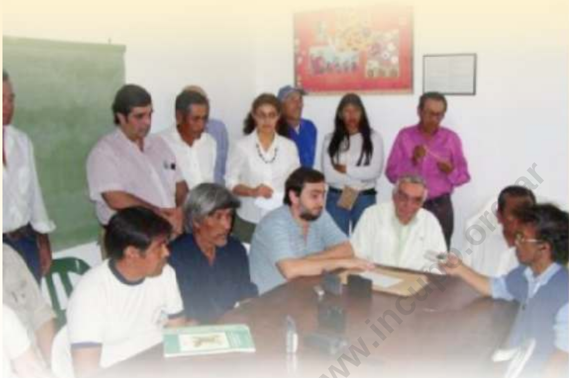
Tierras Indígenas. Foro por la tierra, Chaco 2006.