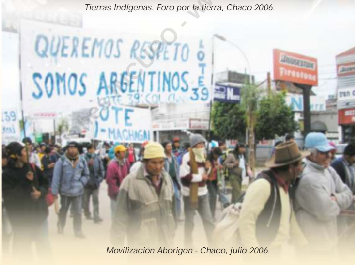
Movilización Aborígen - Chaco, julio 2006.