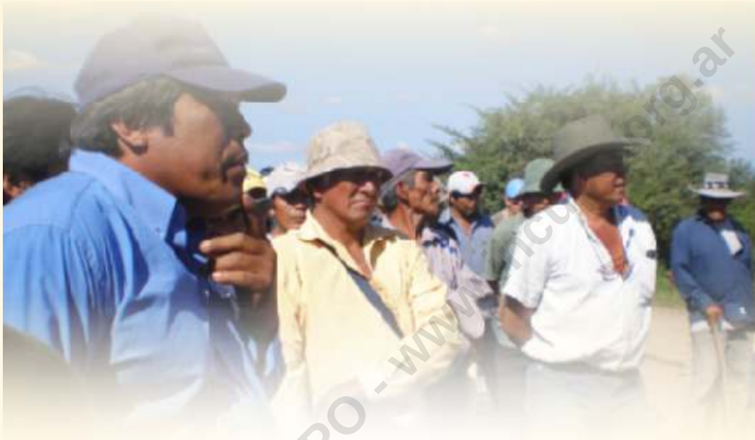
Movilización aborígen en Pampa del Indio, Chaco, abril de 2008.